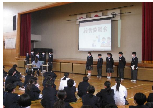
＜昨年度の給食委員の発表＞