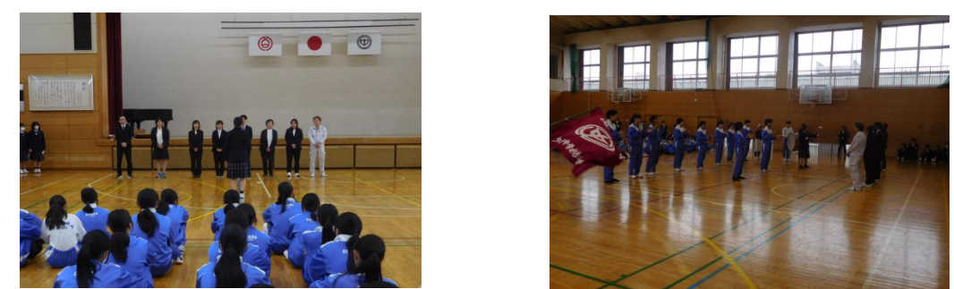
転入職員歓迎式(4月1日水曜日)の様子 生徒たちが温かく迎えてくれ、また、力強いエールもいただきました。 1年間、よろしくお願いいたします。