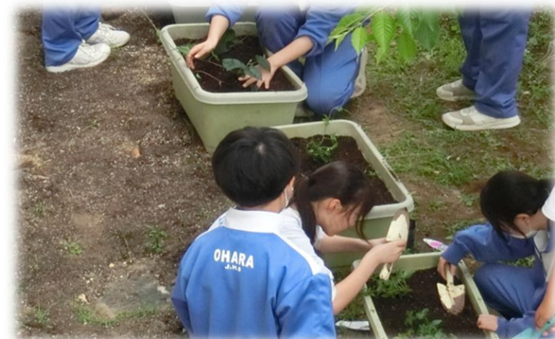
みどりのカーテン準備開始(4月30日)