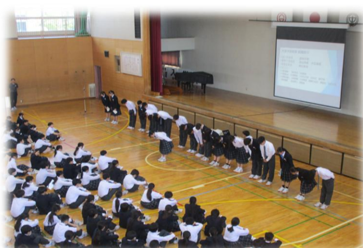
生徒朝会(体育委員会)(5月11日)