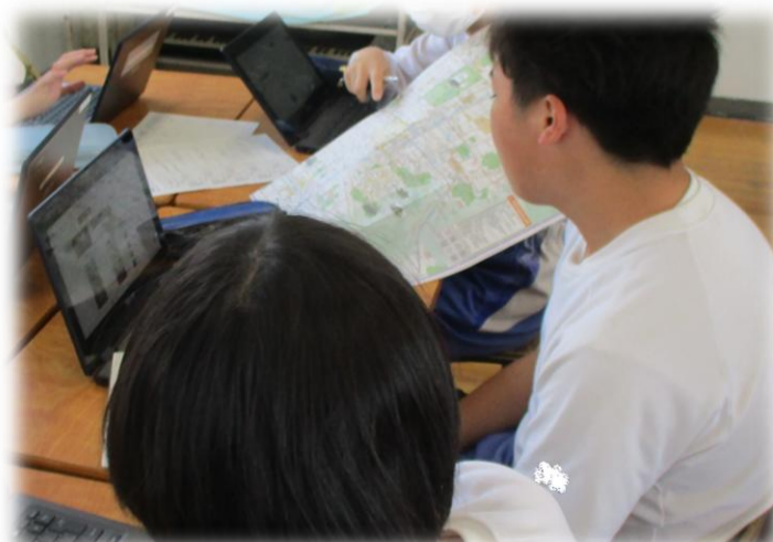
3年生修学旅行事前学習(5月14日)