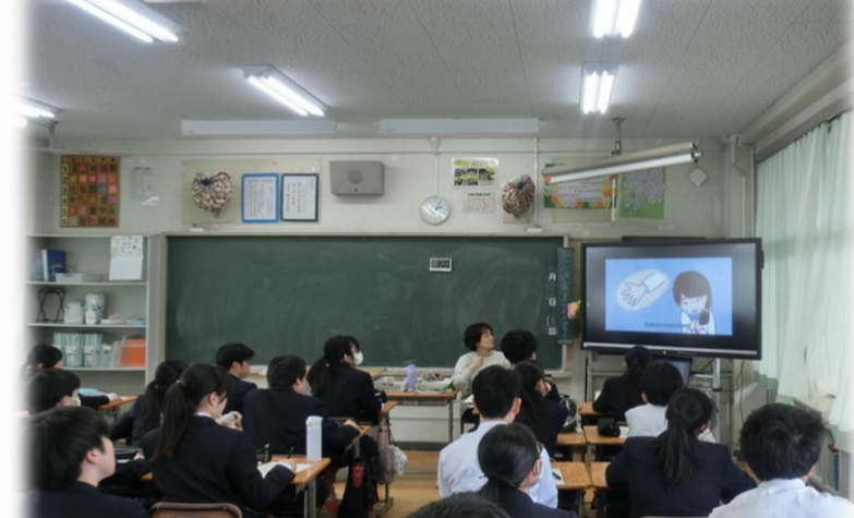
3年生SOSの出し方教育(4月23日)