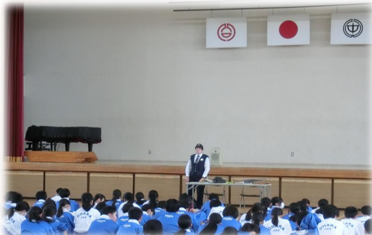
1年生交通安全教室(4月24日)