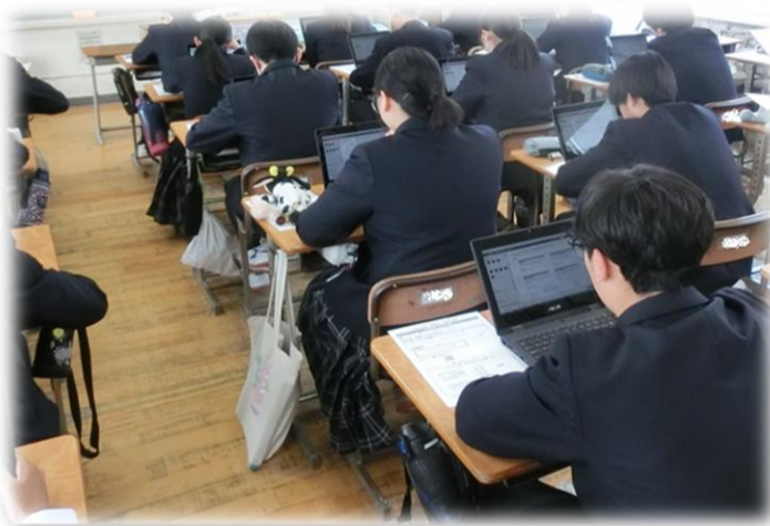
3年生全国学力・学習状況調査(4月21日)