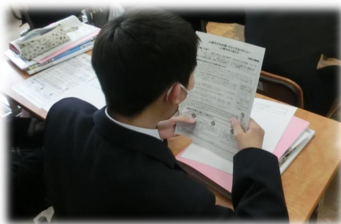
2年生人権作文作成(4月23日)